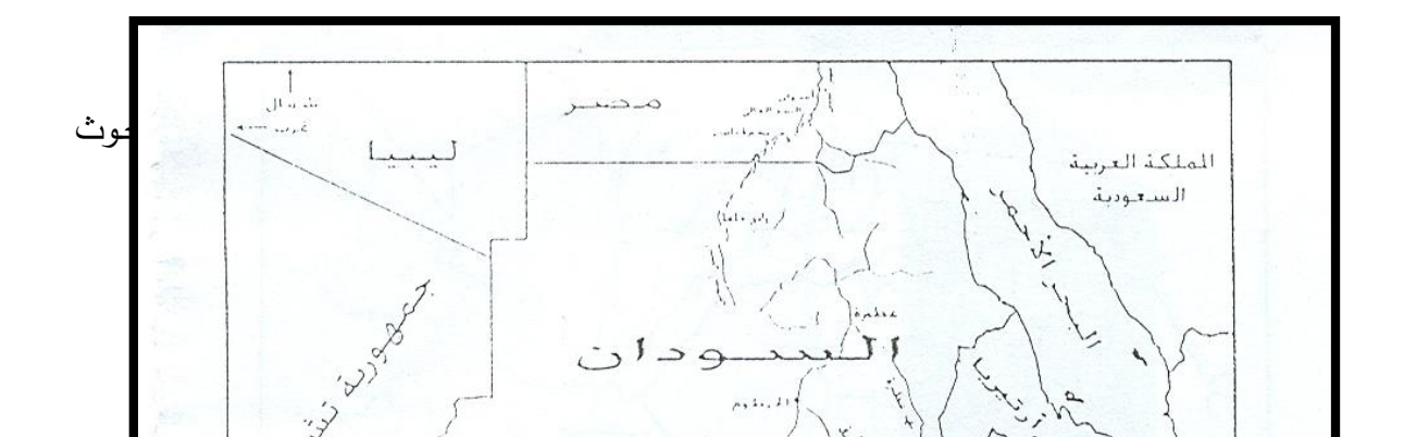
خارطة (٢): دول الجوار الجغرافي لجمهورية السودان

يجاور السودان قطرين عربيين كبيرين من الناحية الشمالية الشمالية الغربية وهي جمهورية مصر العربية والجماهيرية الليبية، ثم انه يجاور ثلاث اقطار ذات اغليبة سكانية اسلامية هي ارتيريا واثيوبيا وتشاد. ويجاور السودان اربعة دول افريقية خالصة وهي كينيا واوغندا والكونغو الديمقراطية وافريقيا الوسطى من الناحية الجنوبية والجنوبية الغربية (۱) السودان بمعرفة هذا يكاد يكون محاطاً باليابسة ويجاور ٩ دول انظر الخارطة