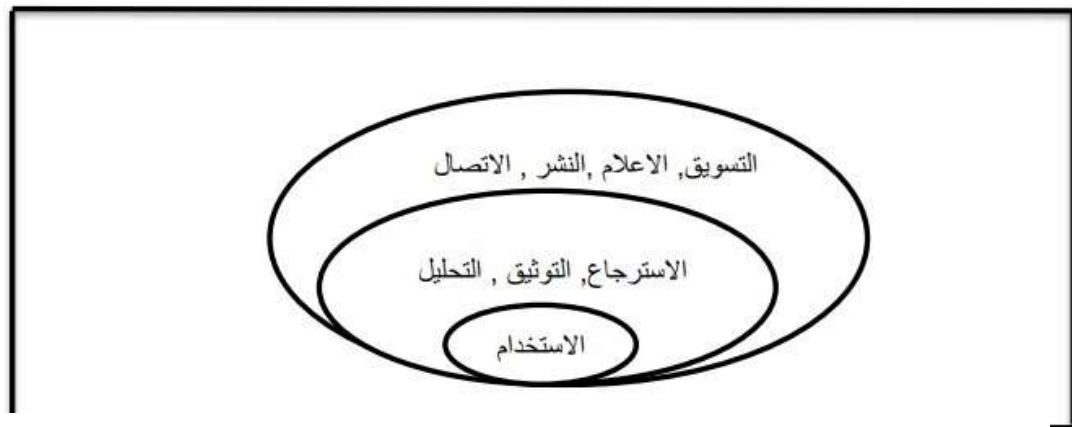
الشكل رقم (٧) نموذج الاستخدام للمعلومات (الشهريلي ، ٢٠٢١)

نموذج استخدام المعلومات: يعد الاستخدام من العمليات والخصائص ذات الأهمية والاستخدام هو مدى الإفادة من المعلومات وهي القوة الحقيقية للمعلومات عندما تكون حالتها الديناميكية وعند استخدامها ويرتبط الاستخدام بنموذج محدد (الشهريلي ، ٢٠٢١) يمثله الشكل الاتي: